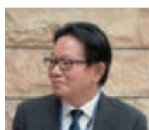
就職支援コーディネーター

専任のコーディネーターがインターンシップや就活のお悩みにお答えします！お気軽にご相談ください。