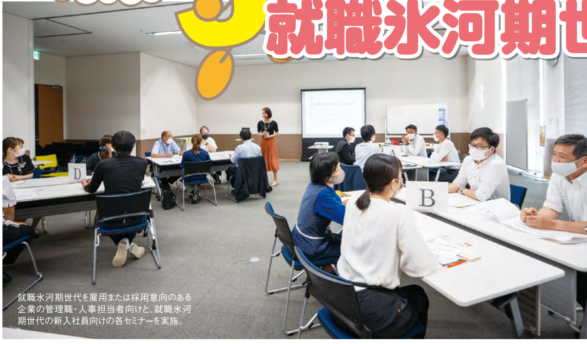
就職氷河期世代を雇用または採用意向のある企業の管理職・人事担当者向けに、就職氷河期世代の新入社員向けの各セミナーを実施。

雇用環境が厳しい時期(おおむね1993年から2004年までの間)に高校や大学を卒業した世代(令和3年4月1日時点において35歳から50歳までの方)